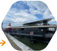
la Barge du Crous de Paris