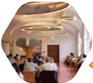
la Cité internationale