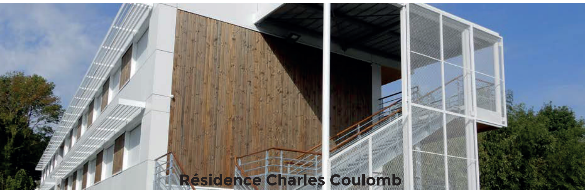
Résidence Charles Coulomb