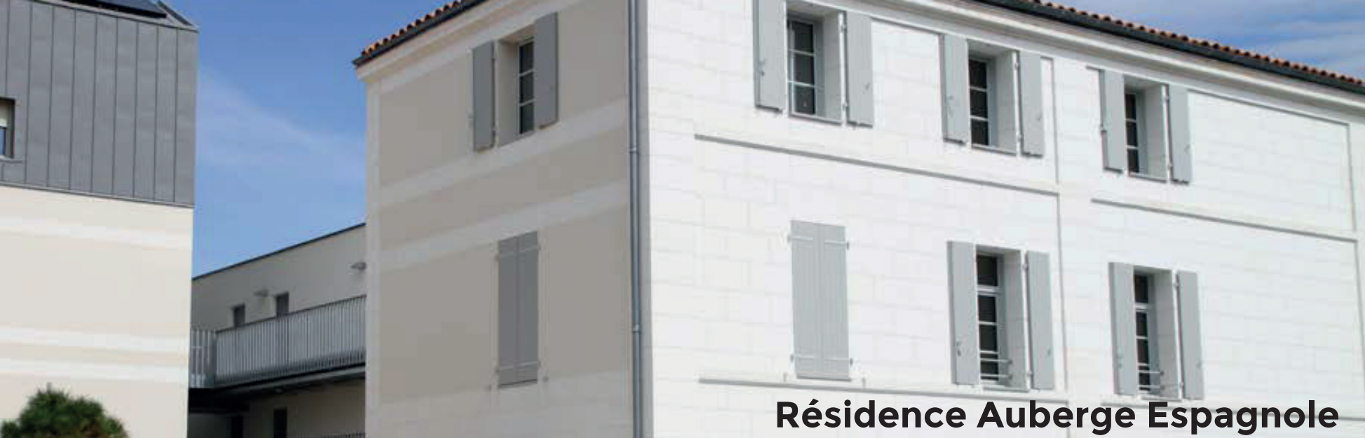
Résidence Auberge Espagnole